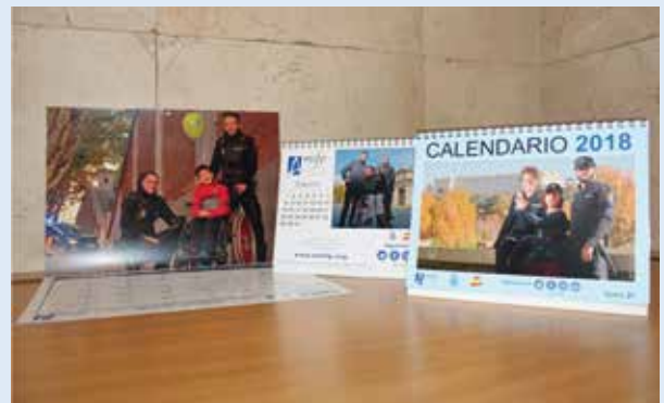
La asociación muestra su agradecimiento a todos los policías y usuarios de Amifp que han participado

Todo aquel que desee el calendario, de mesa o de pared, puede adquirirlo a través de la página web www.amifp.org , por teléfono o enviando un mail a la asociación.