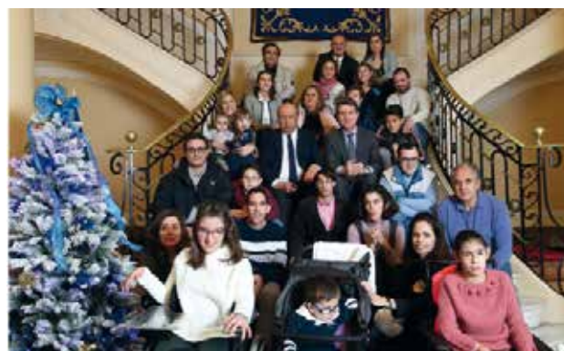
Las familias de Amifp posan en las escaleras de la Sede de la Dirección General de la Policía

En un ambiente festivo próximo a la Navidad, las familias de Amifp tuvieron la oportunidad de charlar entre ellas y conocerse mucho mejor. También tuvimos oportunidad de entablar conversación con el director general de la Policía, Germán Lopez Iglesias, sobre futuras acciones de la entidad y mostrando la predisposición de Amifp de ir de la mano de la Dirección General de la Policía.